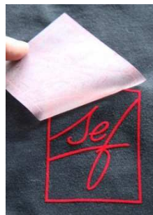
Trägerfolie abziehen, fertig!

VelCut Evo ist mit Viskoseflock in 20 Farben beflockt. Dieselben Farben sind auch in Transflock verfügbar, so dass sich große Auflagen an Flocktransfers, mit Transflock konventionell im Siebdruck hergestellt, perfekt mit Flocktransfers aus VelCut Evo kombinieren lassen. Für größere Auflagen steht auch die stanzfähige Variante DIE-CUT p-bac in den gleichen Farben zur Verfügung. VelCut Premium ist mit Polyamidflock in vier Fluorfarben erhältlich.